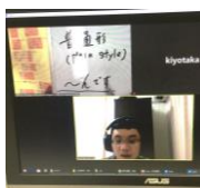
▲オンライン日本語授業の様子

世界中の状況が刻々と変化している中、特に渡航制限や外出自粛等で会津へ来られない留学生とは、日々連絡を取り合い状況確認や、オンラインでの教育提供体制を整えています。また学内の国際交流についても一部オンラインで開催するなど、できる限りこれまで通り行えるように環境整備を進めています。海外への学生派遣プログラム各種は延期・中止の判断をし、来年度万全の状態を実施できるよう準備を開始しています。引き続き皆様のご理解、ご支援を宜しくお願い致します。