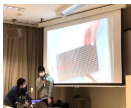
▲開発品のプレゼン

Arduino講習会&ハッカソンイベント「Arduino Dojo」を2021/3/30 ~ 31に実施しました。講習会には1、2年生9名が参加。Arduinoを初めて触る学生もいましたが、Geek Dojo SAIによるハンズオン形式の講習により、約4時間で様々なLチカ(LEDを点滅させること)をはじめ、Arduinoの制御方法を習得。参加者からは「Arduinoの習得に独学で2週間かかった友人がいたのに、自分はこの講習会でたったの4時間で習得できた！」などの喜びの声が聞けました。今回好評だったことから、第2回を企画中です！